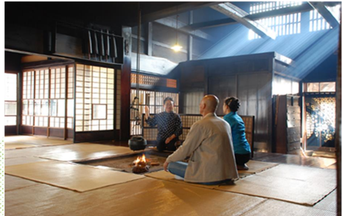
木曾の歴史 宿場・保存の歩みを説明します。