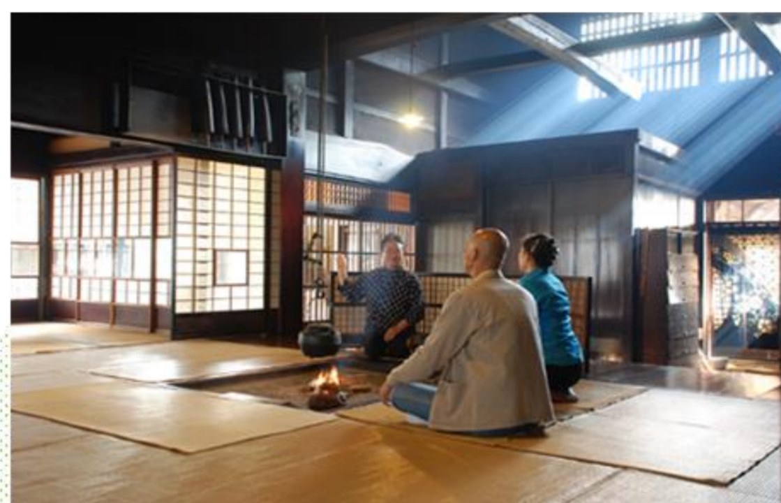
木曾の歴史 宿場・保存の歩みを説明します。